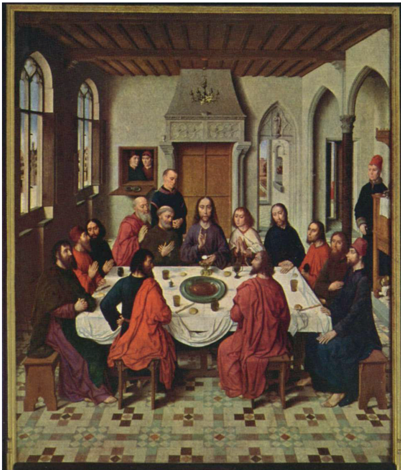
DIRK BOUTS: Sakramentsaltar (1464–68), Öl auf Holz, Mitteltafel 150 x 180 cm (Peterskirche zu Löwen). Abbildung © Wikimedia Commons (Ausschnitt).

querrechteckigen Tafel. Vier Männer erweitern die historische Abendmahls-gemeinschaft. Die gesamte Szenerie charakterisiert eine gesammelte Ruhe, der emotionaler Überschwang fremd ist.