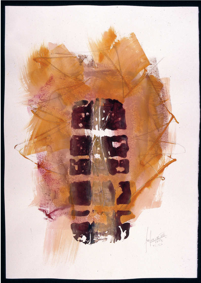
GERHARD MEVISSSEN: Fährte Mensch II.12.7 (Emmasweg), Aquarell, 74 x 52 cm (Privatbesitz). Abbildung © Gerhard Mevissen.

Solchen Bildwerken muss der Betrachter mit einer entsprechenden Haltung begegnen: «Ratsam ist es hier, einfach zu schauen und – ebenso wie ich als Maler – zu warten, bis ich das Bild damit belehne, dass es mich anschaut, und ich beginne, es als ein Gegenüber zu betrachten, an dem ich mich selbst gewinnen kann. Dann richte ich mich persönlich im Bildraum ein und bringe es mir selbst zu Ende in Erscheinung. Und so kann sich mein Blick umstellen von Begriff auf Weite. So kann mein Zeitempfinden sich verwandeln von der getakteten zur strömenden Zeit. Das Bild wird zu einem Ort der Besinnung